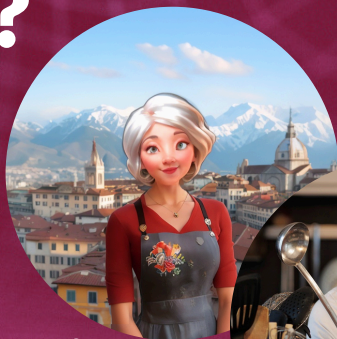
Zia Sofia CogitAI